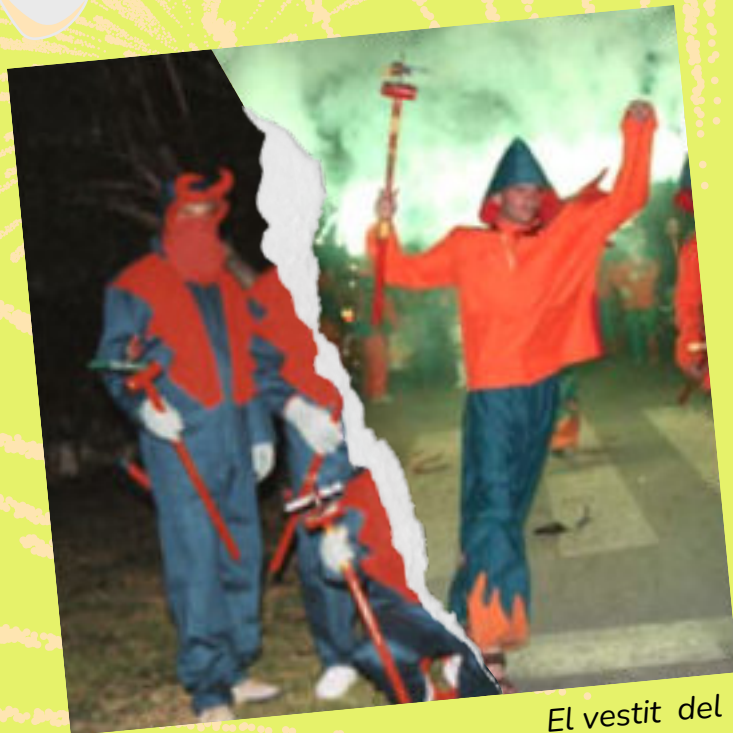
El vestit del 1999/2004