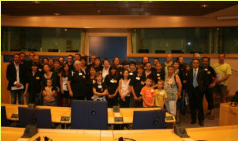
un autocar d'airenovencs rebut per eurodiputats catalans al Parlament europeu per a defensar correfocs.