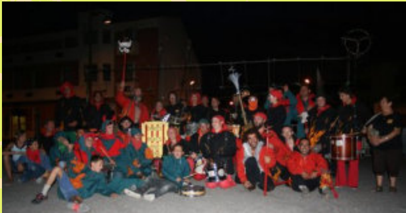
El 3 de gener de 2010, a davant la immobilitat de l'estat francès, Diables i Bruixes del Riberal feien un exili simbòlic a Alforja, seu de la FDDC.