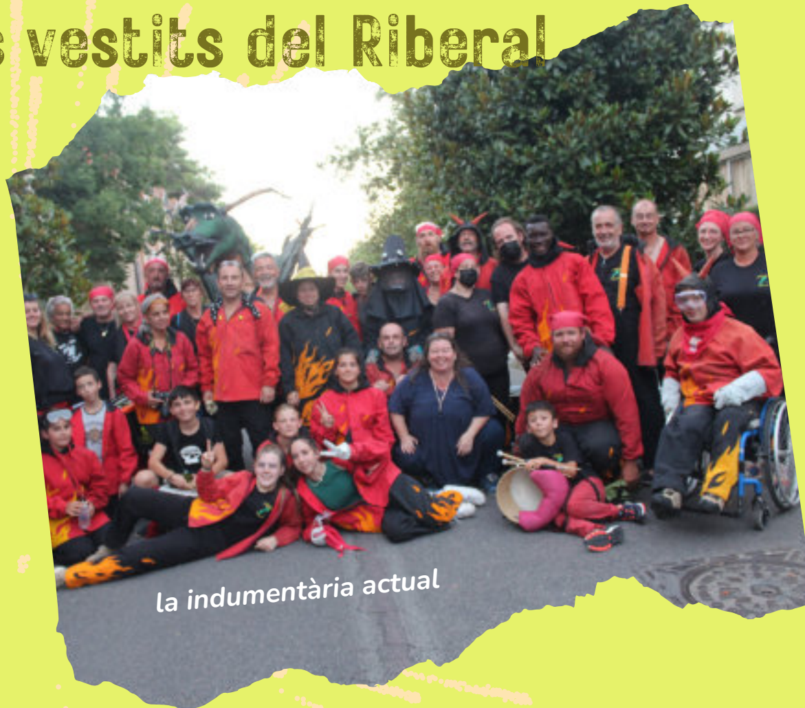
la indumentària actual

El vestit actual de la colla és el tercer. És de lluny el millor que hem tingut mai, és fabricat per una professional de la indumentària dels Balls de diables.